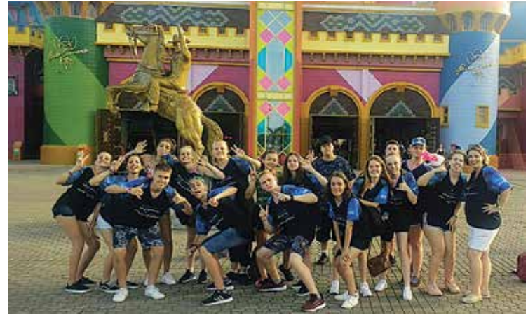
Estudantes conheceram o Beto Carrero World

24 em Balneário Camboriú, em Santa Catarina. Foram momentos de conhecimento, diversão, integração e despedida dos colegas.