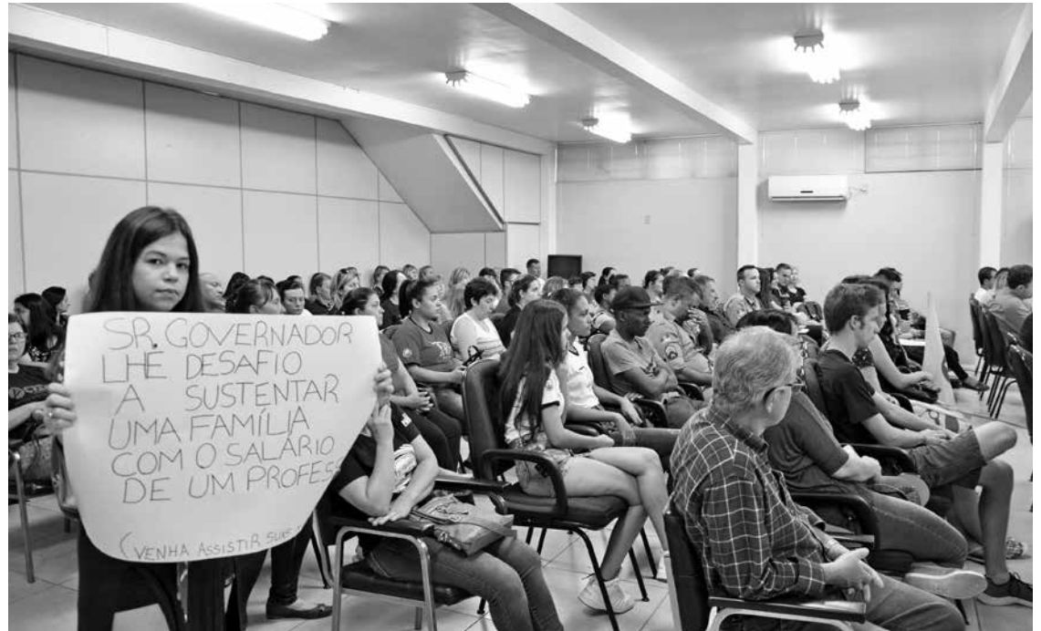
Ontem, professores, alunos e comunidade lotaram plenário da Câmara de Vera Cruz

Pela região, as Câmaras de Santa Cruz do Sul, Vale do Sol, Venâncio Aires, Rio Pardo e Passo do Sobrado já enviaram moções de repúdio. Sinimbu deve votar na noite de hoje e encaminhar a Porto Alegre