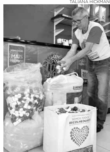
Doação será para a Liga

Há 20 anos, uma campanha semelhante a da Benoit é realizada pela Paróquia Evangélica de Ferraz, no interior de Vera Cruz. O recolhimento das tampas plásticas, que começou no grupo da OASE, tem beneficiado o Hospital Ana Nery. Além dessa, outra ação encabeçada pelo grupo de deficientes arrecada lacres de alumínio. Neste mês, o